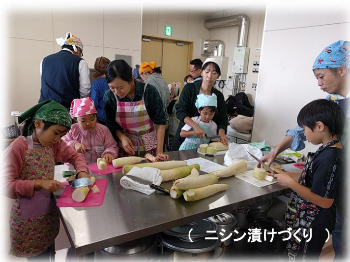
( ニシン漬けづくり )