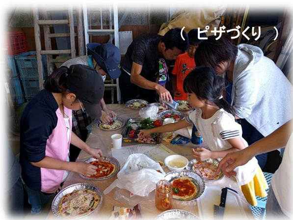
( ピザづくり )