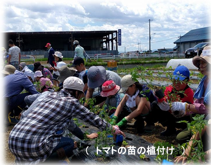
( トマトの苗の植付け )