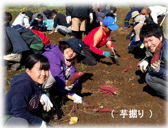
( 芋掘り )