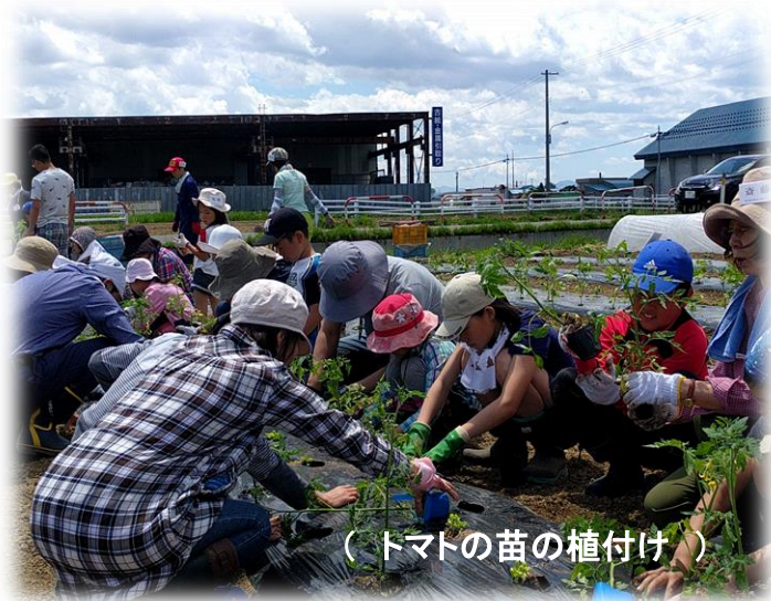
( トマトの苗の植付け )