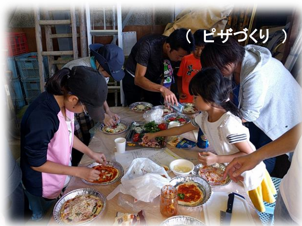
( ピザづくり )